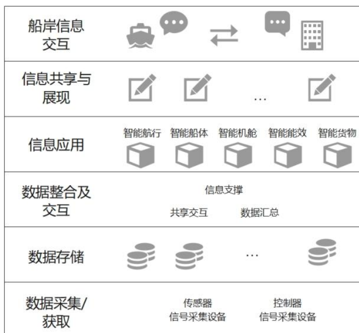
图 7.3.1 系统总体结构示意图

(1) 数据采集/获取：利用感知设备（如传感器）、控制器、信号采集设备及数据采集