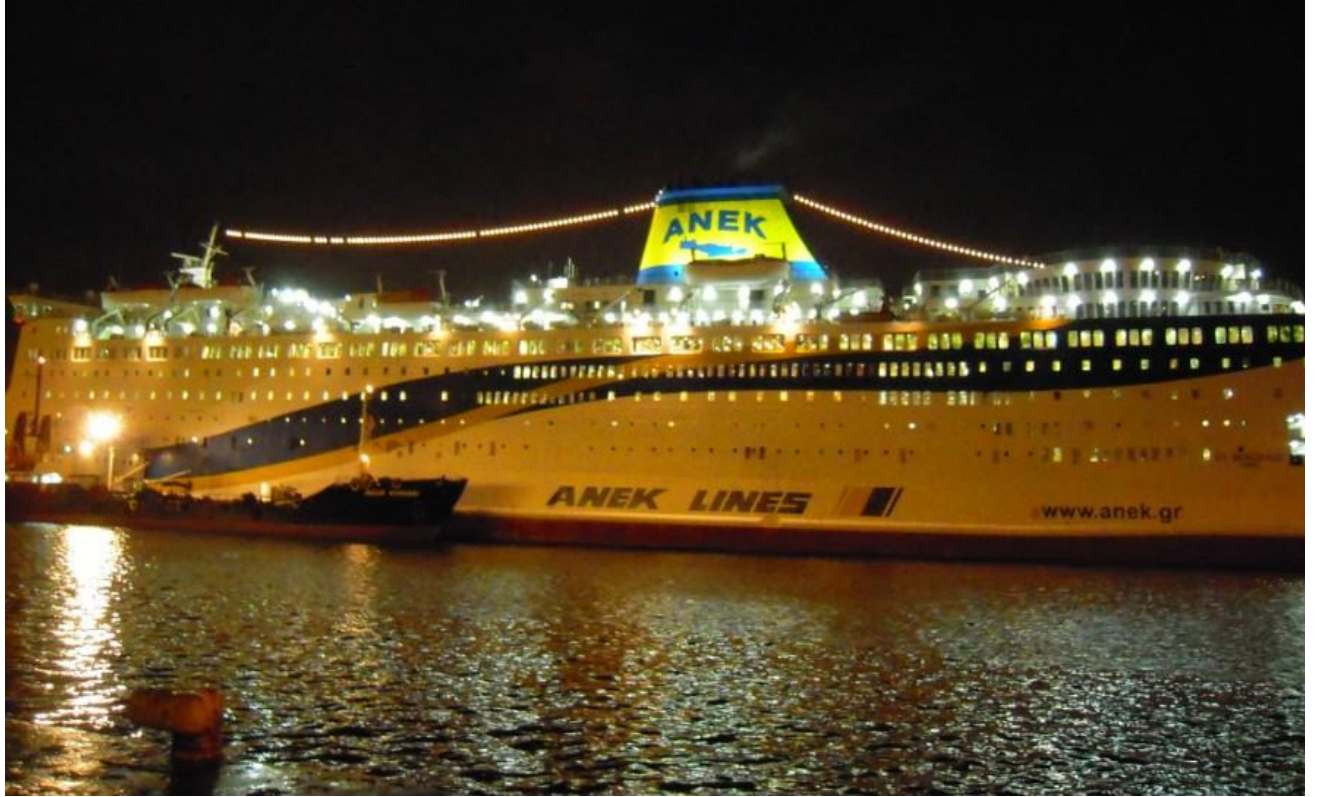
希腊 ANEK 公司的邮轮。